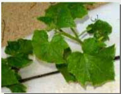
Gurke: Nano-Gro® Gruppe nach 6 Tagen