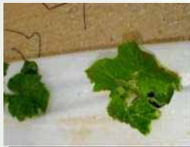
Gurke: Kontrollgruppe nach 6 Tagen