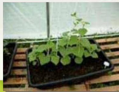
Gurke: Kontrollgruppe nach 17 Tagen