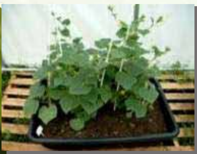
Gurke: Nano-Gro® Gruppe nach 17 Tagen